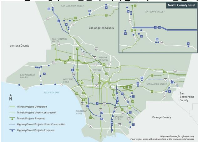
<그림 1> 향후 40년간의 지하철·고속도로 건설 계획