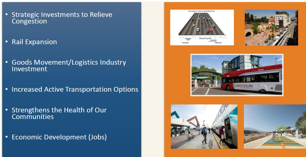
<그림1> SCAG의 주요 과제

주 : 혼잡 비용 저감을 위한 전략적 투자, 철도 확장, 물류 이동/물류 산업 투자, 향상된 교통수단 제공, 지역 사회의 건강증진, 경제 발전(일자리).